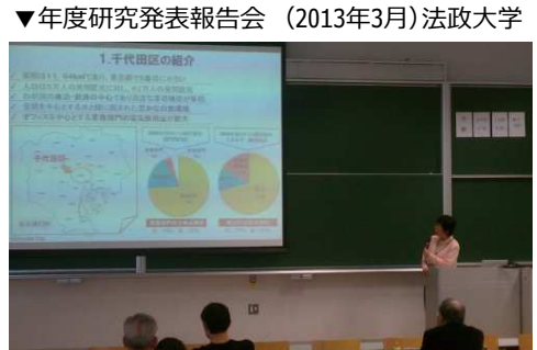
▼年度研究発表報告会 (2013年3月) 法政大学