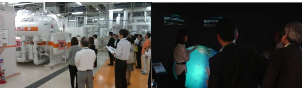
▲千代田エコツアー / 第3回 サスコミ部会 (2013年6月)