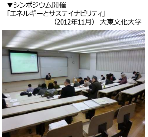
▼シンポジウム開催 「エネルギーとサステナビリティ」 (2012年11月) 大東文化大学