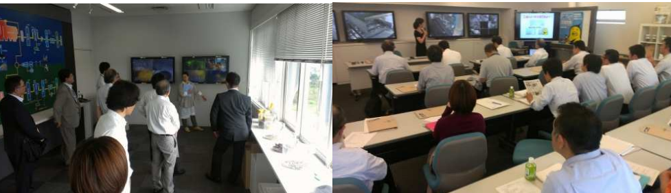
▲東京スーパーエコタウン見学会 / 第3回 サスコミ部会 (2013年10月)