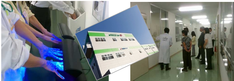
▲ユーコープ様 見学会 / 第2回 サスコミ部会 (2012年10月)