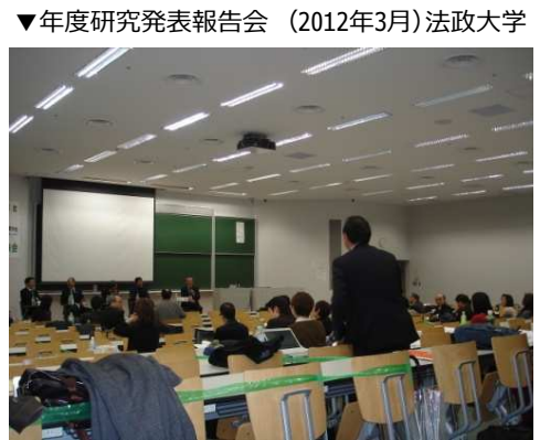
▼年度研究発表報告会 (2012年3月) 法政大学